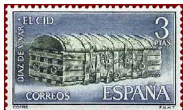
Cofre, Catedral de Burgos.1962