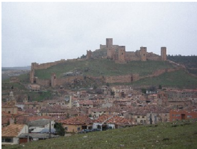
Molina de Aragón

Cuando se cita al Cid, en muchas ocasiones se añade una frase del estilo de que en tan buen hora nació o que en buen hora ciñó la espada .