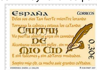
Sello conmemorativo de 2007

Es el más frecuente. Aparece ciento setenta y tres veces. Y hay razones para que sea así pues hay dos parejas que son protagonistas en varias partes relativamente largas. Se trata de las hijas del Cid, doña Elvira y doña Sol a las que se alude como “dos” en cincuenta y siete veces y los Infantes de Carrión, don Diego y don Fernando, con quienes las casaron, que son aludidos en cincuenta y una ocasiones. Por lo tanto, entre estas dos parejas, se cubren ciento ocho citas del número dos. Las bodas entre ambos y la afrenta de Corpes son los episodios en los que, obviamente, se les cita con mayor