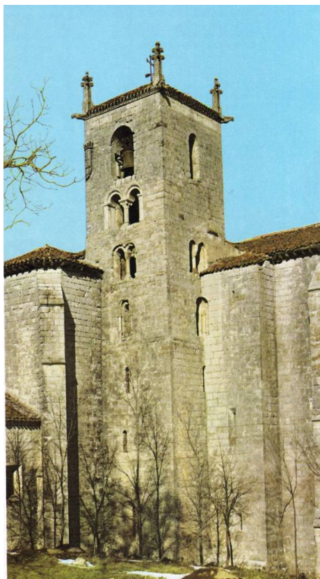
San Pedro de Cardeña

El día y la noche aparecen en el mismo verso en diez ocasiones indicando así también un tratamiento del día como alusiva a la parte de luz solar y noche a la de oscuridad; no siempre en ese mismo orden: