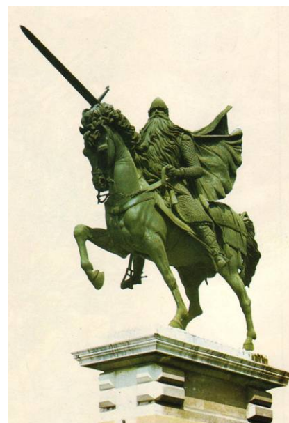
El monumento al Cid en Burgos

Dos mástiles la levantan los dos son de oro labrado.