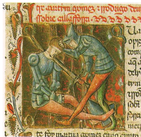
Lucha del Cid con Martín Gómez. Miniatura de Crónica de España.

Aparece en cinco ocasiones referido a cuatro elementos diferentes: