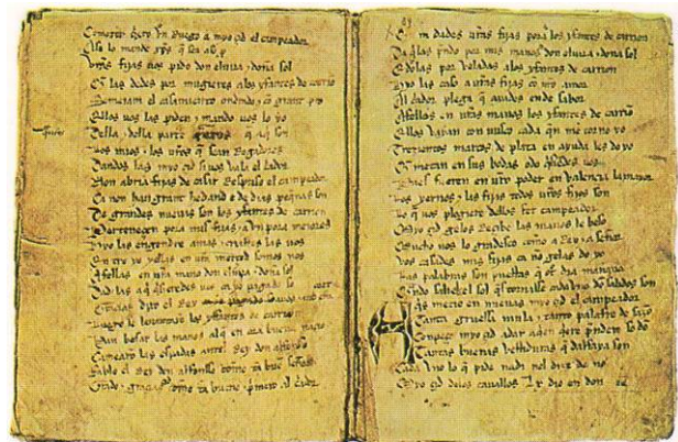
Manuscrito que se conserva en la Biblioteca Nacional