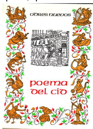
Portada del libro

No entraré ni en el análisis de la obra ni en ningún tipo de valoración sobre la posible exageración de cuanto se cuenta, pues una vez que pasa a ser una historia popular, que se transmite al principio de forma oral, hay una tendencia a transformar