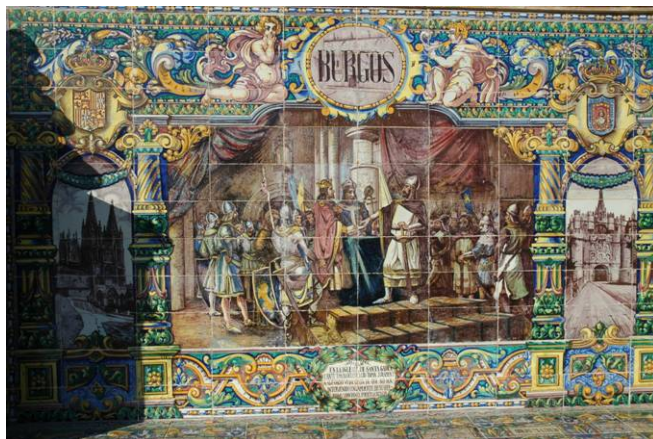
Burgos. Plaza de España. Sevilla