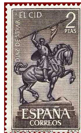
El Cid ecuestre; serie de 1962