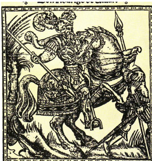
Portada de Cronica del famoso e invencible cavallero Cid Ruy Díaz Campeador

Es la cantidad de guerreros que pide el Minaya Alvar Fáñez para participar en la lucha contra el rey Yúsuf, de Marruecos, cuando atacó Valencia.