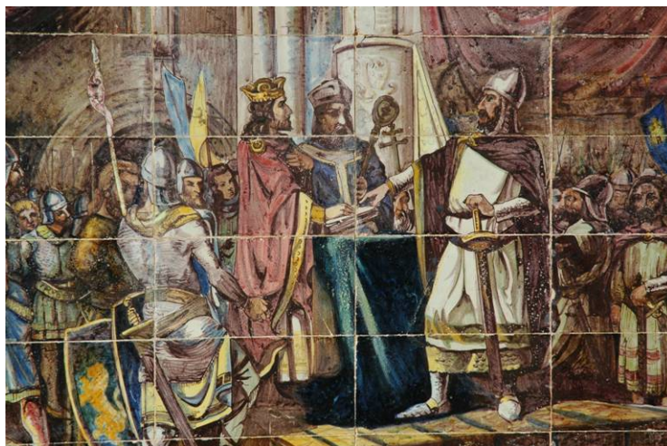
Detalle. Mosaico de Burgos. Plaza España. Sevilla

6.- Desde el camino del destierro hasta el final hay un total de 3730 versos. En 647 de ellos existe al menos un término que puede ser considerado matemático (número cardinal u ordinal, unidad de medida, etc.)