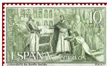
Juramento en Santa Gadea