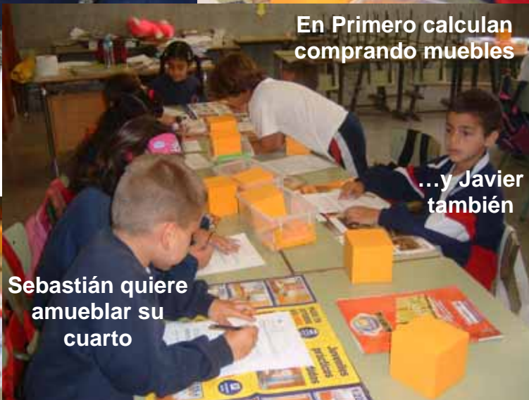
En Primero calculan comprando muebles