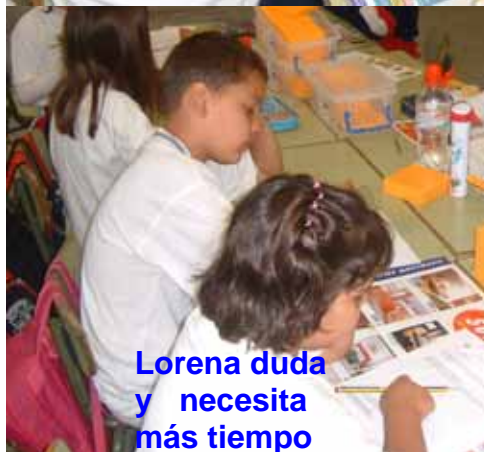
Lorena duda y necesita más tiempo