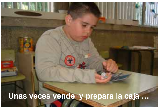
Unas veces vende y prepara la caja ...