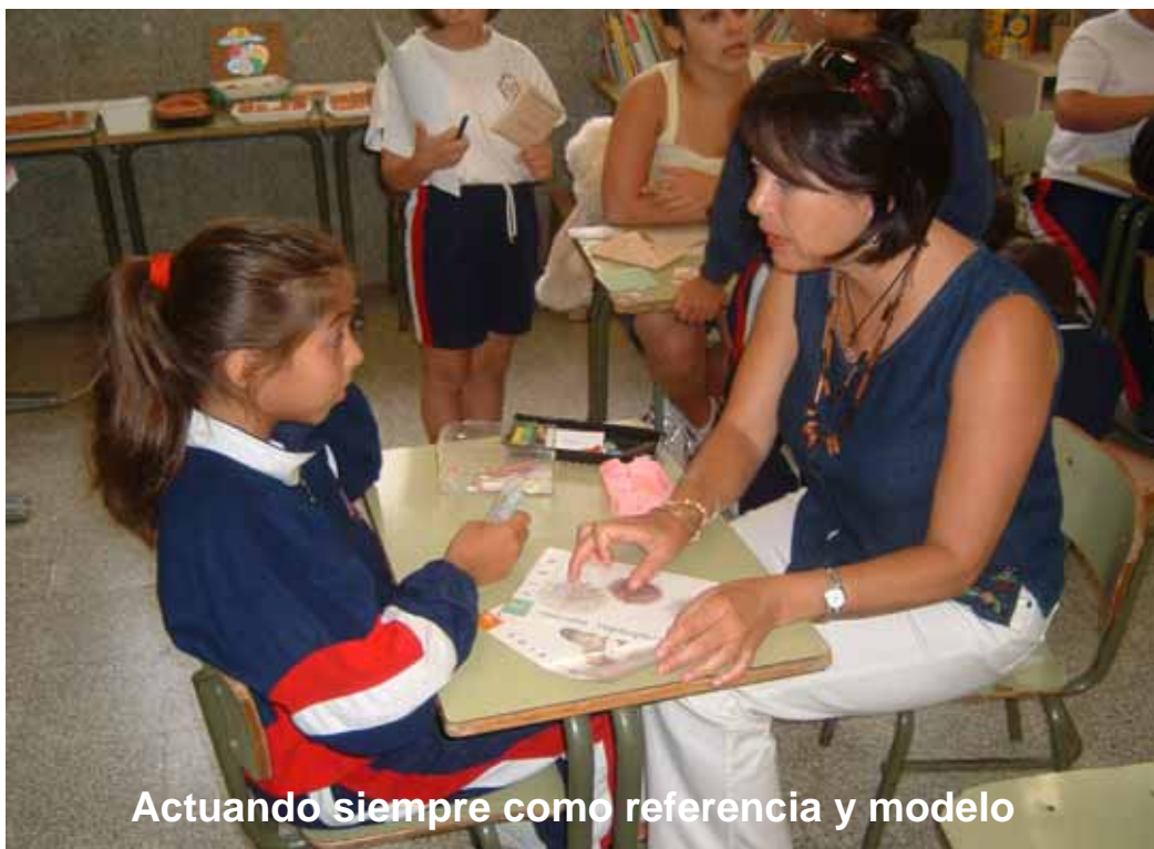
Actuando siempre como referencia y modelo

Hay que especificar que está implícito en este trabajo, y en todos los de nuestro centro, la filosofía del Programa de Competencia Social del Prof. D. Manuel Segura Morales, (está en la bibliografía) ya que las buenas relaciones interpersonales que se dan en la interacción social, es lo que hacen posible que surja el debate, el intercambio de puntos de vista, llegar a acuerdos o mantenerse en desacuerdos argumentados asertivamente desde el respeto y la consideración, desarrollando así una autonomía moral e intelectual que de otra manera no se daría.