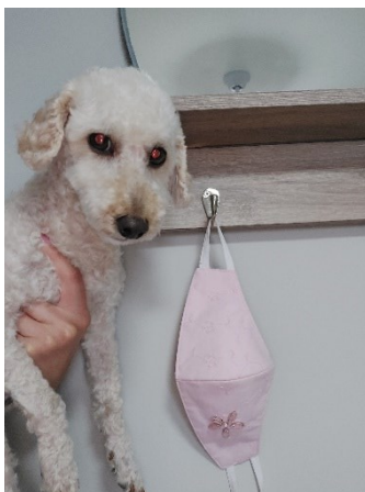
Figura 2. 3 Imitación de imagen de una de las estudiantes del grupo B en la aplicación Whatsapp .

Esto permite que otra estudiante del grupo comience a experimentar y envía fotos a sus compañeras para mostrar y validar su conjetura inicial. Interesa señalar que las estudiantes ponen en juego cuestiones y conocimientos tecnológicos basando sus conjeturas en la experimentación (Borba y Villarreal, 2005), no emplean nociones matemáticas en la validación. Una de las integrantes se toma una selfi con su celular y la envía por la aplicación Whatsapp del celular al resto del grupo B.