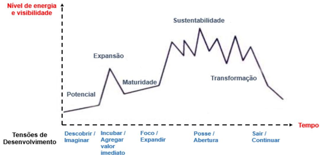
Figura 1: Estágios de desenvolvimento de uma Comunidade de Prática

maturidade; sustentabilidade e transformação. Contudo, é importante ressaltar que os referidos estágios não possuem um tempo de duração definido a priori .