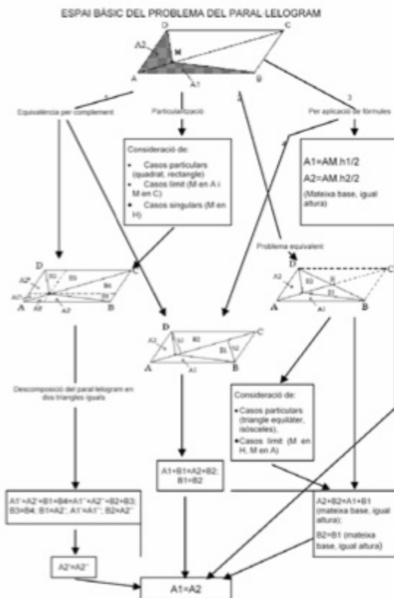
Figura 1. Dibujo de las posibles tres resoluciones en (Cobo, 2004)