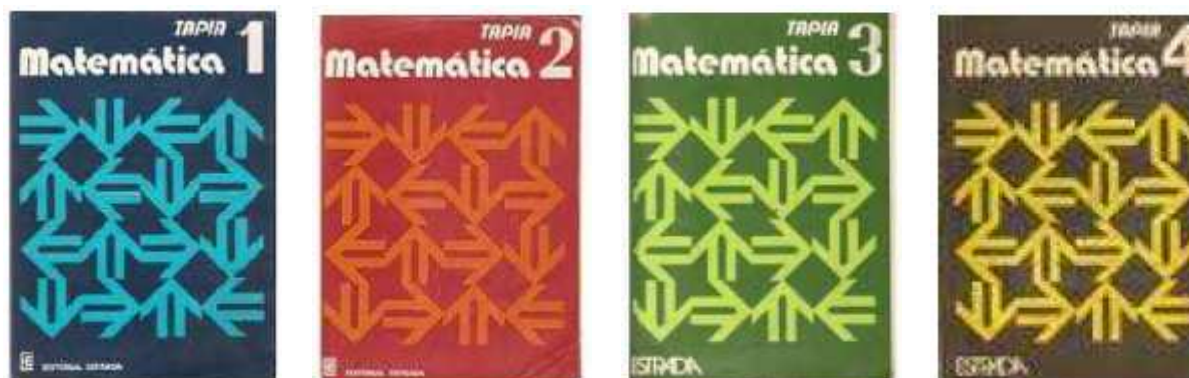
Portadas de los textos de Enseñanza Secundaria

A continuación presentamos algunas imágenes de las portadas de esos libros que fueron una enorme ayuda para tantos docentes: