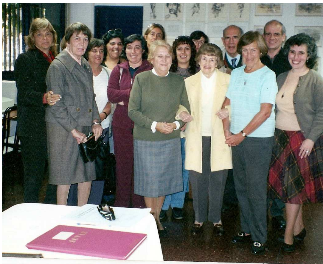
Asamblea de SOAREM durante su Presidencia

Integró la Comisión constitutiva de la FISEM, con los Presidentes de las Sociedades que la conforman, asistió en Tenerife – España al inicio de actividades y elección de autoridades.