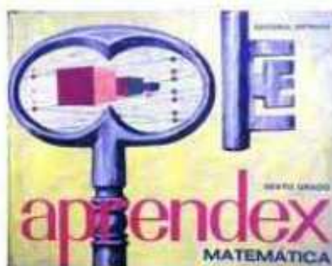
Algunas de las portadas de los libros de primaria

Trabajó incansablemente para que la Sociedad Argentina de Educación Matemática lograra los ambiciosos objetivos que se propusieron en la Asamblea Constitutiva del 31 de octubre de 1998 en la Ciudad de Buenos Aires y para obtener la Personería Jurídica por Resolución N°000530 de fecha 31 de mayo de 1999.